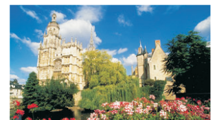
Ci-dessus : Evreux