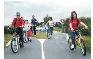
Ci-dessus : sur la voie verte