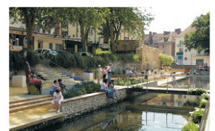
Ci-dessus : les berges de l'iton à Evreux